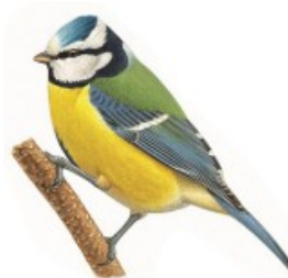
2 ème Mésange bleue