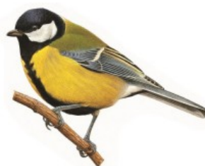
2 ème Mésange charbonnière