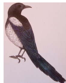
3 ème Pie bavarde

L'espèce la plus fréquente est le Rouge-gorge familier présent dans 15 des 19 jardins soit dans 79% des jardins. La Mésange bleue est présente dans 12 jardins ( 63 %) tandis que la Pie bavarde est présente dans 11 jardins (58%). La Mésange charbonnière et le Merle noir arrivent ensuite en 4 e position, ces deux espèces sont présentes dans 10 jardins (53%).