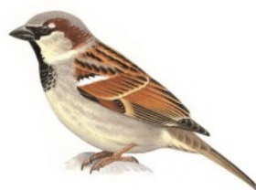
1 er Moineau domestique

Classement des espèces les plus abondantes, celles qui comptabilisent le plus d'individus au total.