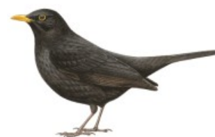
3 ème Merle noir