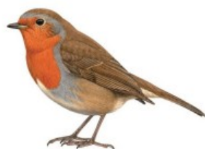
1 er Rouge-gorge

Classement des espèces les plus fréquentes, celles étant présentes dans le plus grand nombre de jardins.